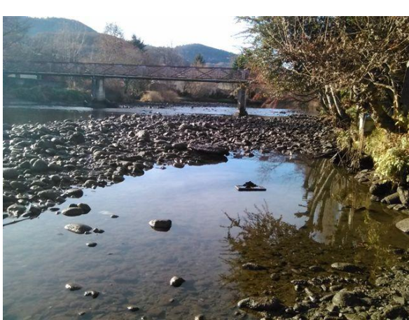
Figure 1 Lez 25 -12-2016