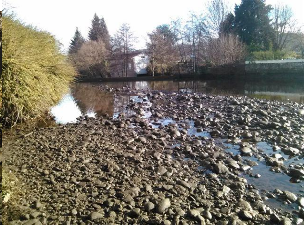
Figure 2 Lez 25-12-2016