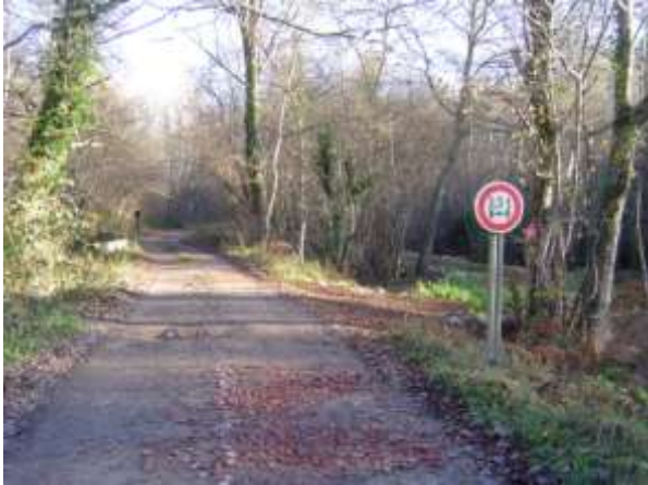
Chemin de Micoulau