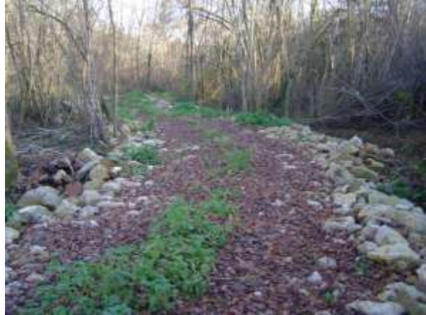
évitement du pont