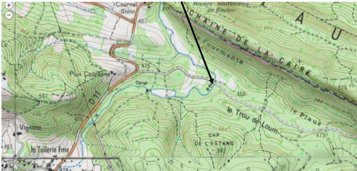
Situation des travaux

L'évitement rendu, nécessaire pour faire passer des engins de fort tonnage, semble consécutif à une coupe de bois et à l'évacuation des grumes qui en résulte.