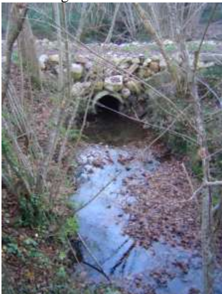
Busage sur le Carol